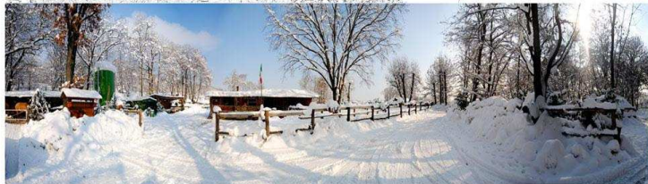
Centro Ippico "Le Fontanelle"